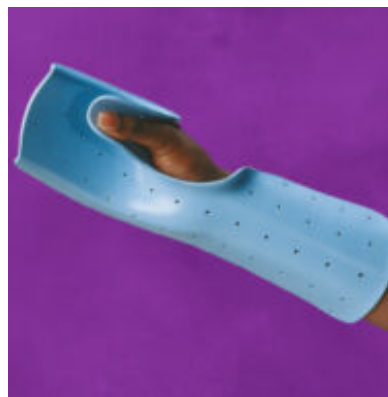
Spectre des Matériaux Thermoformables Rolyan