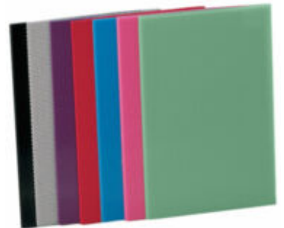
Spectre des Matériaux Thermoformables Rolyan