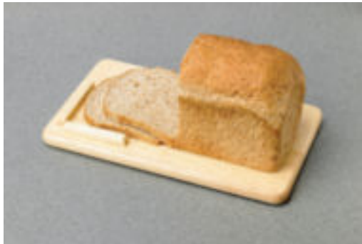
Planche à découper le pain en bois