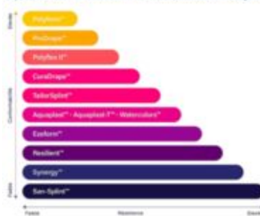
Spectre des Matériaux Thermoformables Rolyan