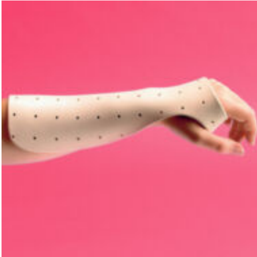
Spectre des Matériaux Thermoformables Rolyan