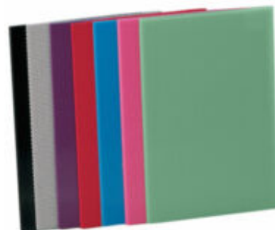
Spectre des Matériaux Thermoformables Rolyan